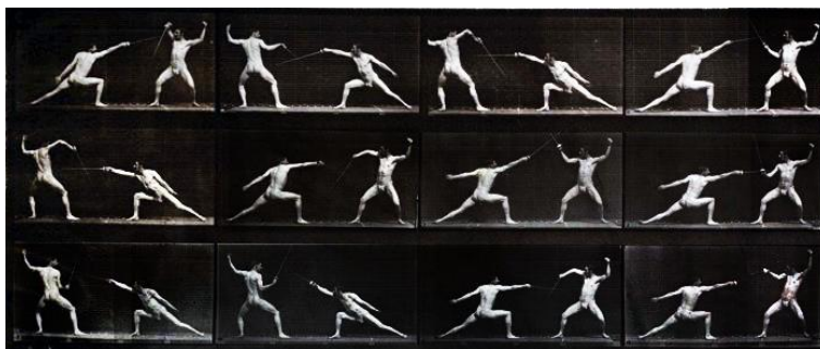
Hronofotografija lepote mačevalačkih pokreta forme d`art martial, Eadweard Muybridge, 1887.