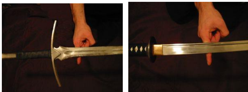
Balans kod japanske dvoručne sablje je više pomeren prema vrhu sečiva nego kod jednoiporučnog evropskog mača

No, pošto katana nema kontrateg ona je u izvesnoj meri debalansirana (pomeren je centar mase sečiva prema njegovom vrhu) pa njeno sečivo prilikom zamaha ima veći moment inercije nego sečivo evropskog mača čime je povećana njena moć sečenja, a što je od značaja s obzirom na oklop koji su koristili samuraji.